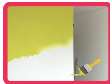
Massa fina ou corrida